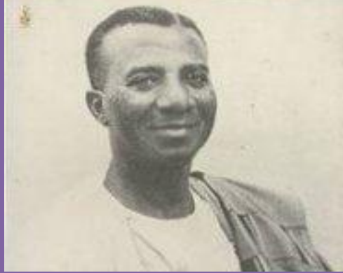
Sylvanus Epiphonio Kwame Olympio