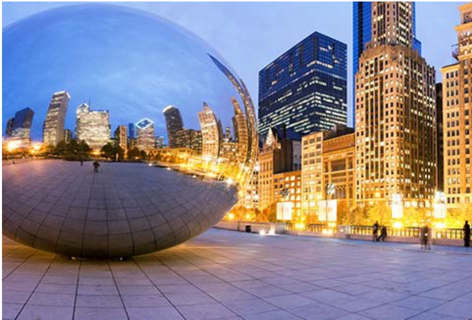
Le Togo appelle sa Diaspora à Chicago... Place aux idées et actions novatrices...