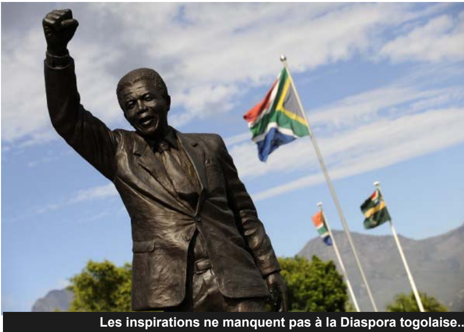
Les inspirations ne manquent pas à la Diaspora togolaise...